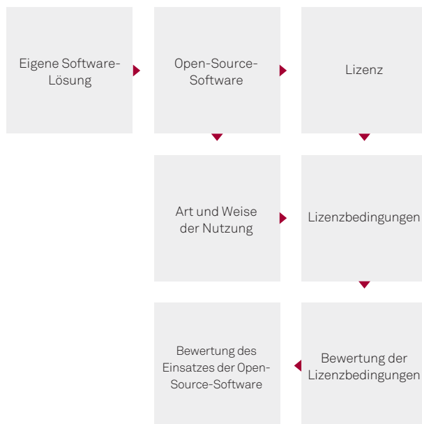
Abb. 2: Vorgehen zur Bewertung des Einsatzes einer Open-Source-Software

Wir erstellen für Sie einen Prüfbericht, der neben den Ergebnissen der Analyse insbesondere unsere Handlungsempfehlungen bei Problemfällen umfasst. Die Empfehlung kann zum Beispiel lauten, eine andere Open-Source-Lizenz zu wählen, eine verwendete Open-Source-Software zu ersetzen oder sie in der Software-Lösung auf eine andere Art technisch einzubinden,